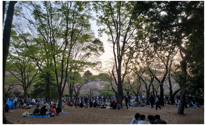
Photo du parc Yoyogi à la saison des cerisiers.

Si revenir à Dauphine a quelque chose de jouissif pour certains, la rentrée représente néanmoins un événement douloureux dans la vie de beaucoup d'étudiants, marchant à reculons vers Porte Dauphine. Ayant passé l'année 2022-2023 à l'étranger pour mon M1 au Magistère de Sciences de Gestion, cela fait presque un an que je n'avais pas mis les pieds à Dauphine. Je vais vous partager ci-après mon expérience de stage à Tokyo chez LVMH Cosmetics qui a eu lieu de janvier à juin 2023.